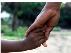
Nr. 1 Anzahl:

Beschreibung: Klappkarten in geschlossenem Format 14,8 X 10,5 cm, 4-farbig auf hochwertigem glänzendem Papier mit UV-Siebdruck Lackierung. Preis: Stück: 1,50 € - Set von 5 Karten: 7 € - Set von 10 Karten: 13 € - Set von 20 Karten: 20 €