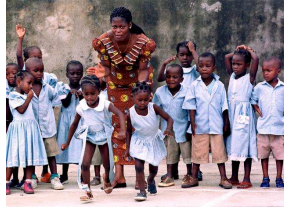
Nr. 7 Anzahl: