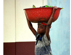
Nr. 5 Anzahl: