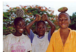
Nr. 4 Anzahl: