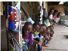
Nr. 6 Anzahl: