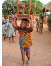
Nr. 8 Anzahl: