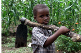
Nr. 3 Anzahl: