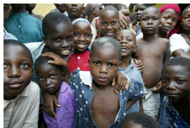
Nr. 2 Anzahl: